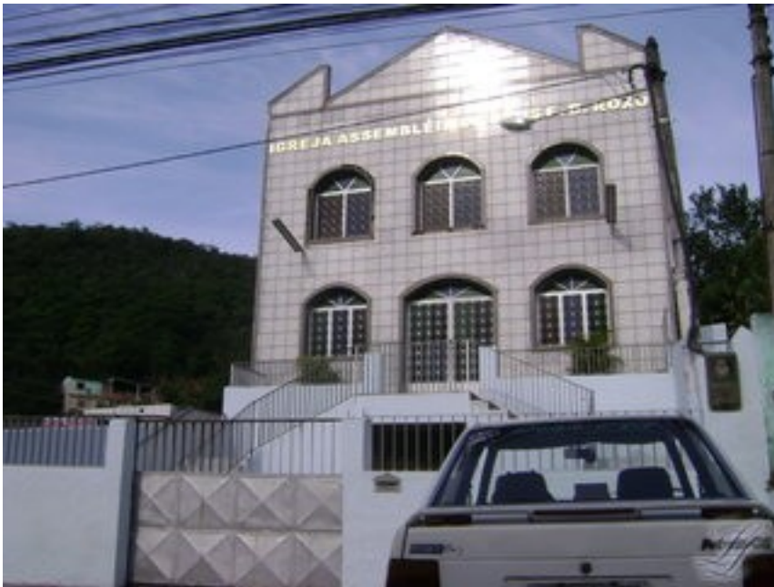
Do lado direito, Assembléia de Deus.