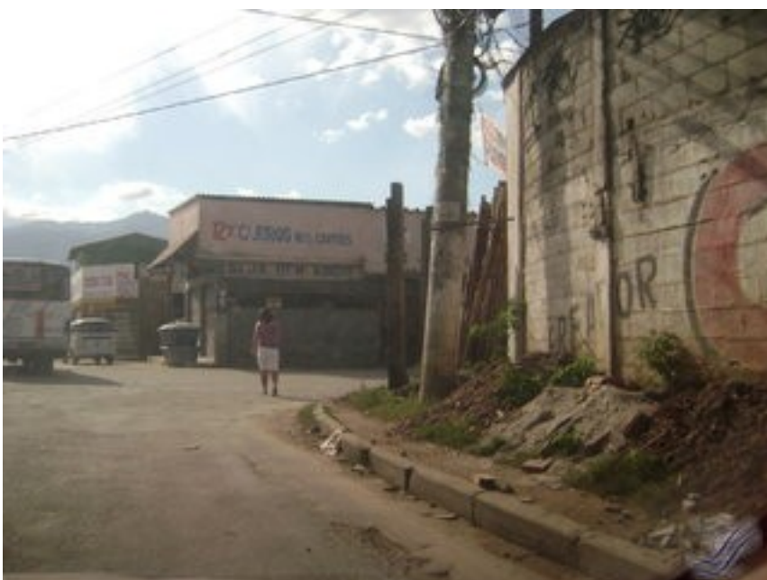
Detalhe do acesso para a Estr Federal de Tinguá. A propaganda na loja a frente informa "12x s/ juros nos cartões"

Prepare-se pois você entrará a direita para acessar a Estr Federal de Tinguá.