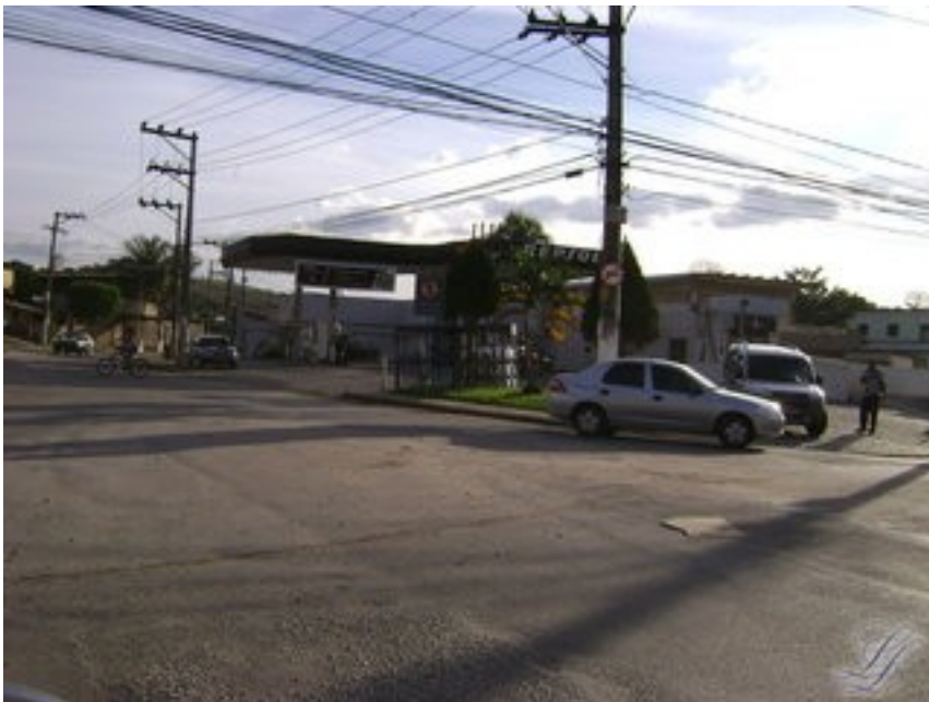
Um pouco mais a frente será possível avistar um cruzamento, do lado esquerdo o posto Repsol.

Prepare-se pois você entrará a direita para acessar a Estr Federal de Tinguá.